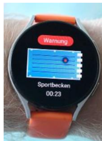
Smartwatch der Badeaufsicht